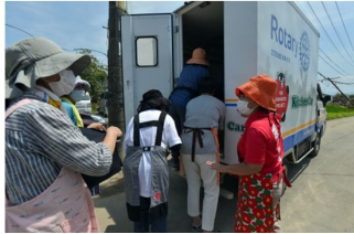
キッチンカーを走らせながら被災者へ地域の状況をお聞きしているところ(日に日に変化する支援の在り方)