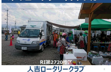
RI第2720地区 人吉ロータリークラブ

毎月一回の割合で命のキッチンカーを走らせ、被災者への支援と交流を行いながら復旧・復興に寄り添ってきました。被災者の皆様にはキッチンカー出動に関してたいへん感謝の言葉を頂き、ボランティアをしていただいた皆様もとても素晴らしい活動だとエールをいただきました。