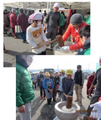
須恵小学校の交流(12.3)

新しい年を迎える準備として西原村の仮設住宅において90キロの餅つきが行われ、キッチンカーを出動し具沢山野菜たっぷりのカツカレーを準備。地元須恵小学校の子どもたちも参加、地域づくり団体「ひとくまネット」の仲間たちと一緒に活動していただきました。