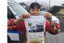
人吉球磨の新米プレゼント(2kg入り)

全国のロータリアンから寄せられた多額の義援金から誕生した命のロータリーキッチンカー 会員やご家族、地元の奉仕団体や地域づくりの連携なくしては継続的に活動することはできなかったと思います。