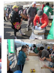
仮設住宅校区対抗運動会(11.5)