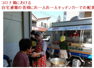
コロナ禍における 自宅避難の皆様にお一人お一人キッチンカーでの配食