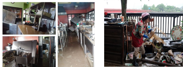
ひまわり亭の被災直後の様子