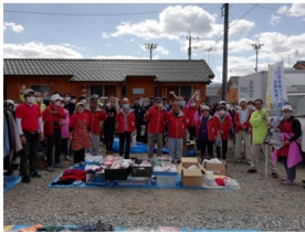
延べ5,000人を超えるボランティアの皆様へ感謝