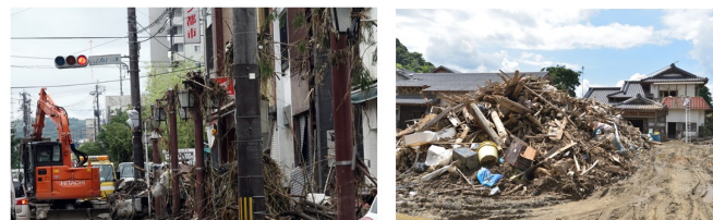
被災直後の片付けの様子