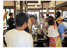
熊本県内の次世代を担う若者達との防災・減災について学び、一緒に防災ランチを作っている様子

各地域に出向き、 食育防災アドバイザーとして出前キッチンカーによる防災食づくり 講座開催