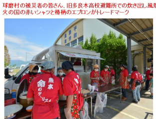
球磨村の被災者の皆さん、旧多良木高校避難所での炊き出し風景 火の国の赤いシャツと格柄のエコロンがトレードマーク