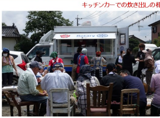
キッチンカーでの炊き出しの様子