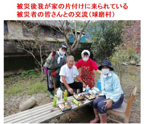
被災後我が家の片付けに来られている 被災者の皆さんとの交流(球磨村)