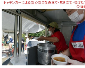
キッチンカーによる安心安全な煮立て・炊き立て・揚げたての提供