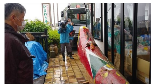
『事務所管理に備わった熊本県人吉市に積りし松木川が 川があふれた！まちが沈んだ日 生きる力をくれたキジ髯くん』