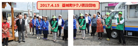
クラブを超えた多くのロータリアンとご家族の支援の輪