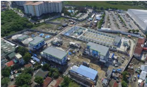
写真-4 パラニャケ下水処理場

処理能力は76,000m 3 /日で、人口約30万人分です。窒素を除去する高度処理対応となっています。敷地が非常に狭いので、沈殿池を複数階にするなど様々な工夫を取り入れています。