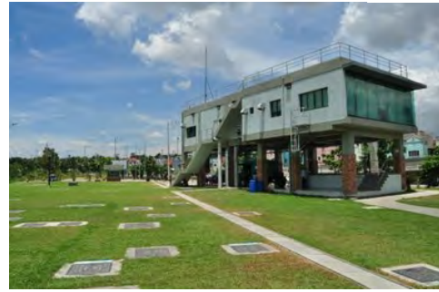
写真-1 オランダス下水処理場

処理能力は11,000m 3 /日で、約4万人分の下水を処理できます。右に見えている建物は、管理棟で、下水処理場本体は左側の芝生（公園）の下にあります。この処理場の左側には河川が流れており、洪水を考慮した設計となっていますが、実際に建設中に大洪水が発生しました。しかも運が悪いことに、工事が完了し、翌週にも客先に引き渡す直前の出来事でした。写真-2、3は洪水後の写真です。