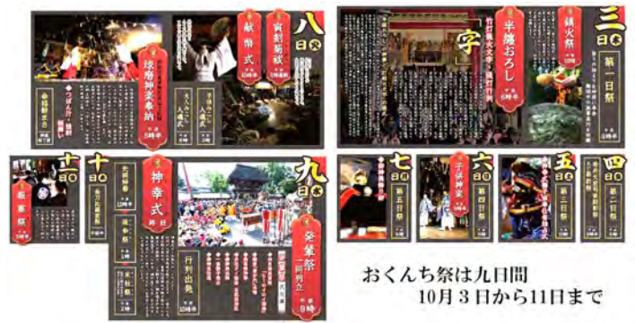
おくんち祭は九日間 10月3日から11日まで

おくんち祭は、平日開催が多くあるため参加者を増やすことに平成24年から、人吉市内の小中学校を家族の時間プロジェクトという国の制度を使って10月9日を学校の休業日としていただきました。氏子地域（東小・西小校区）以外の学校から芸能、神輿の参加が根付いてきました。大畑小&三中の神輿や、西瀬小の法被姿の参加、中原小の子供みこし参加があります。他にも球磨工業高校の神輿（平成23年～）参加。平成20年ごろからの球磨工業高校・人吉校高校カヌー部の行列参加、南稜高校馬術部による道開馬、球磨中央高校の大人神輿や供奉者の参加など、多くの子供、学生に参加をしてもらっています。