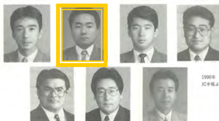
※残念ながら、延岡ガバナーエレクトは名簿にございませんでした