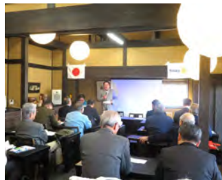
1月17日例会 ひまわり亭 会長代理 葉山バスト会長