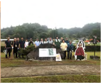
「グリーンひとよし」 8月16日