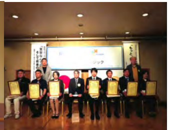
優良職員表彰式 4月18日