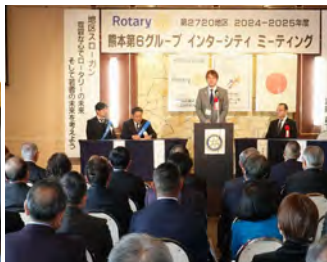
IM 水保 2月8日