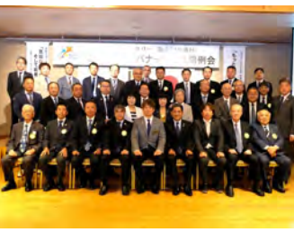
三村ガバナー公式訪問9月13日