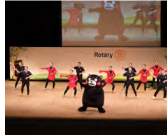
地区大会 熊本市民会館 4月25日