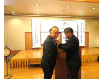
長船会員入会式11月1日