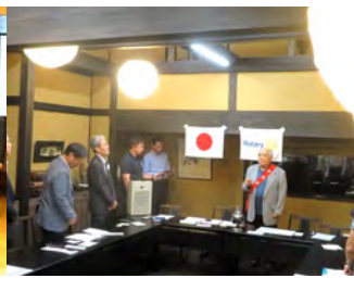
月見例会9月27日 ひまわり亭