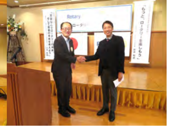
年次総会竹長ノミニ決定12月6日