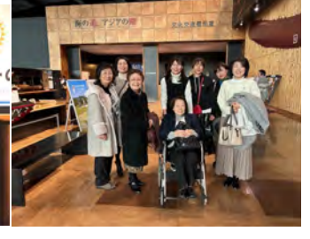
夫人の会 九州国立博物館 「人吉球磨の玉手箱」展12月15日