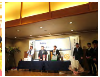
新年会恒例オークション