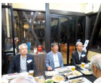
友好クラブ指宿RC 来訪3名 月見例会9月27日