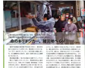
ロータリーの友4月号掲載 “命のキッチンカー被災地へGO!”