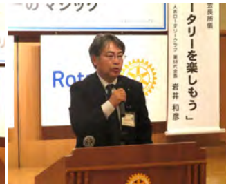
水と衛生月間卓話 人吉市水道局 3月14日