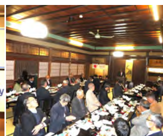
花見会 芳野旅館 4月1日