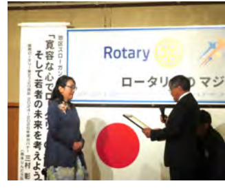
地域発展表彰「あらいぐま人吉」 10月18日