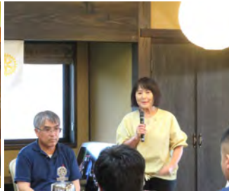
次年度本田ガバナー補佐ご挨拶 8月2日