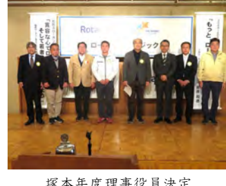
塚本年度理事役員決定