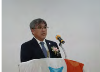
慶山RC50周年式典祝辞