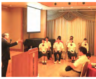
人吉RC奨学生卓話8月23日