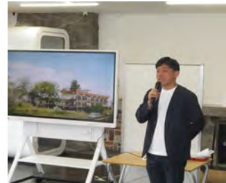
職場訪問例会 くまりば 5月30日