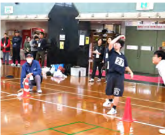
チャレンジカップ 3月15日