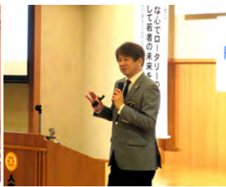
三村ガバナー公式訪問9月13日