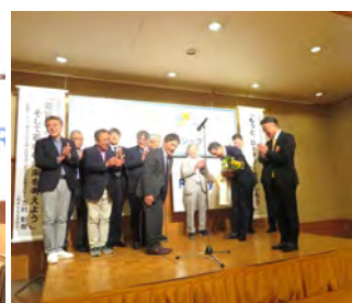
新旧理事役員歓送迎会7月5日