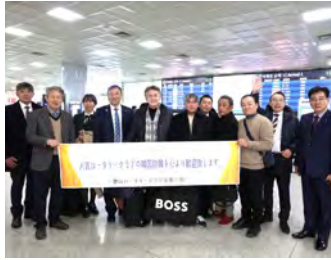
慶山RC50周年・第17次姉妹調印 訪韓1月17日～19日