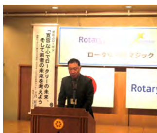
まちづくりと復興の現状について 人吉市役所 3月28日