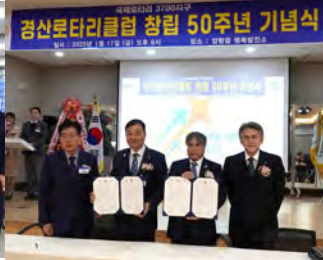
第17次姉妹クラブ調印式 1月17日