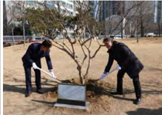
記念植樹(百日紅) 1月18日