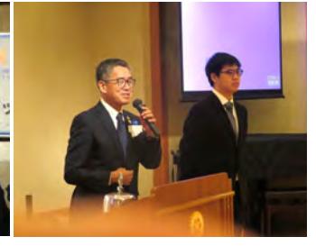
米山奨学生招待卓話10月25日