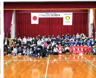
チャレンジカップ 3月15日