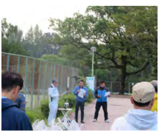
早朝例会(村山公園清掃) 10月11日