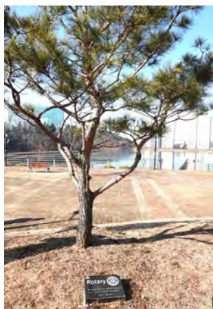
慶山ロータリークラブ創立 40周年記念の植樹 （松の木）

記念植樹式 1月18日(土) 11時30分～ 場所：津梁近隣公園内 城陽公園（慶山市）