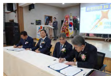
第17次姉妹クラブ調印式の様子