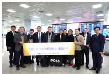
釜山空港にて お出迎え

式典：2025年1月17日(金) 17時30分～ 会場：押梁邑 幸福発電所(慶山市)