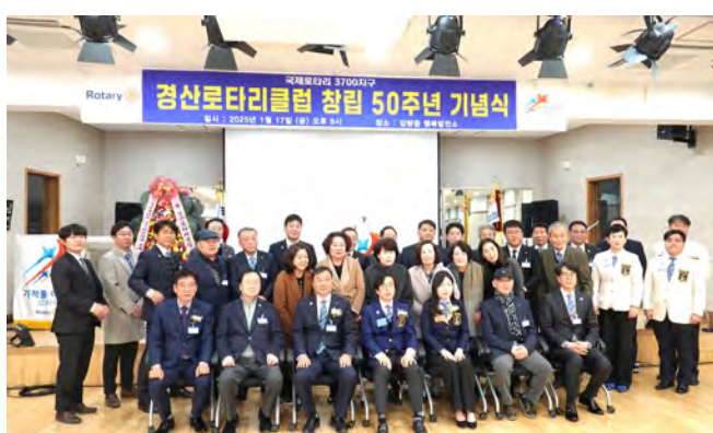
両クラブ全員での記念撮影