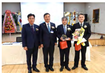
慶山RCから記念品と 花束の贈呈