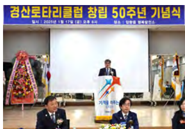
岩井人吉RC会長の挨拶