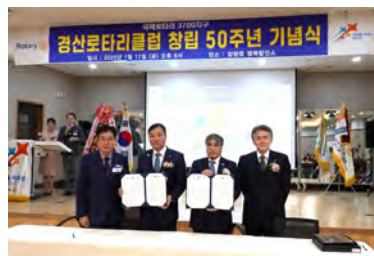
調印式を無事終えて、 両クラブの会長及び 国際奉仕委員長と共に