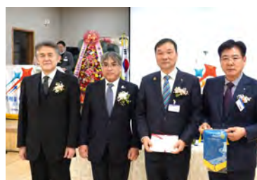
人吉RCからスマイルと バナーの贈呈