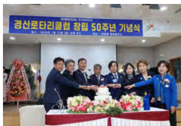
韓国3700地区ガバナー 及びガバナー補佐等と 共に