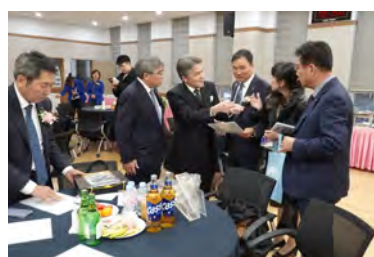
記念式典前のご挨拶