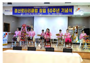
人吉RC来訪歓迎の演奏