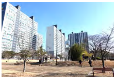
歴代記念植樹の場所