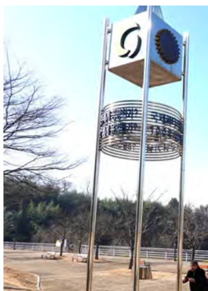
慶山ロータリークラブ創立 30周年記念のモニュメント （R I も協賛）