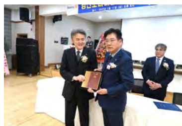
第17次調印及び慶山RC 50周年を記念しての楯 を贈呈