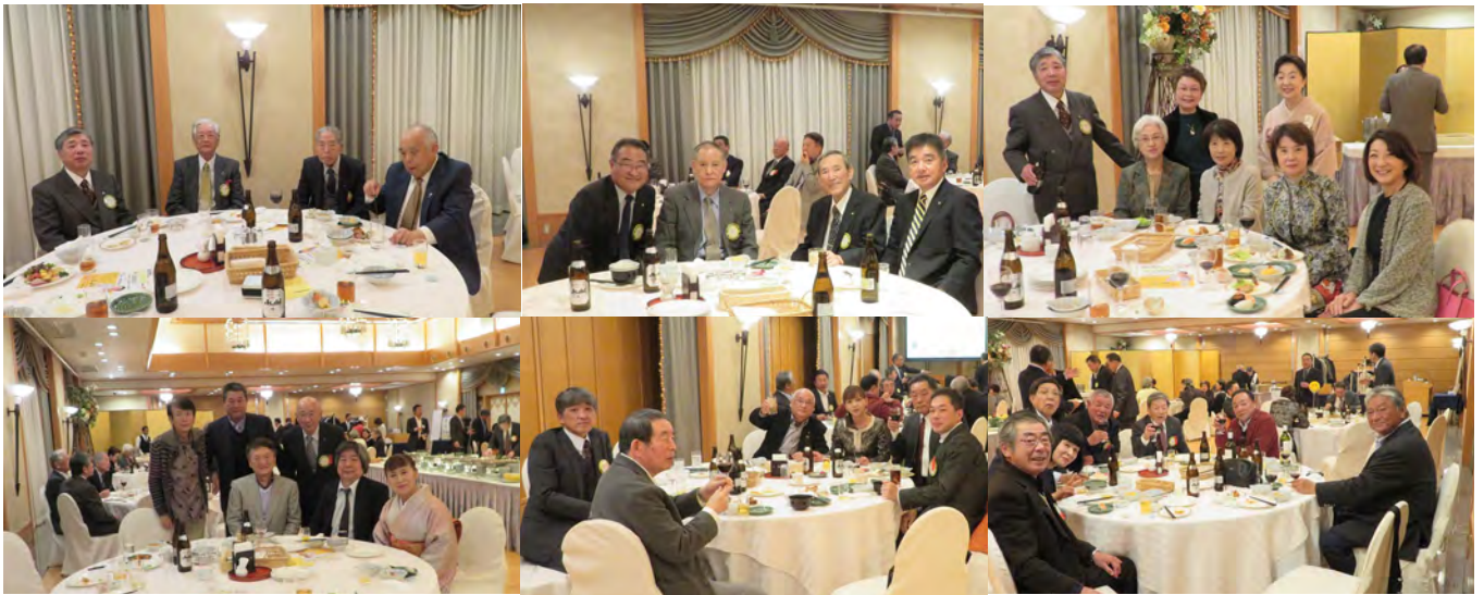
チャリティーオークション 売上金116,500円 ご協力ありがとうございました！