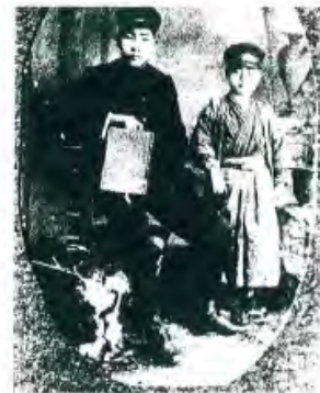
(鉄道建設工事事務所雇員時代 15歳)

平成14年市制60周年に当たり、人吉市名誉市民推戴、平成27年熊本県近代文化功労者として顕彰される。高木の残した膨大な資料は国会図書館他、貴重な資料として保管されている。