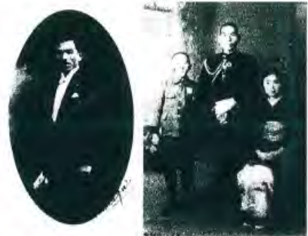
(左はフランス駐在武官時代 (昭和3年))