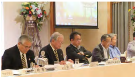
第1回クラブ協議会 前半