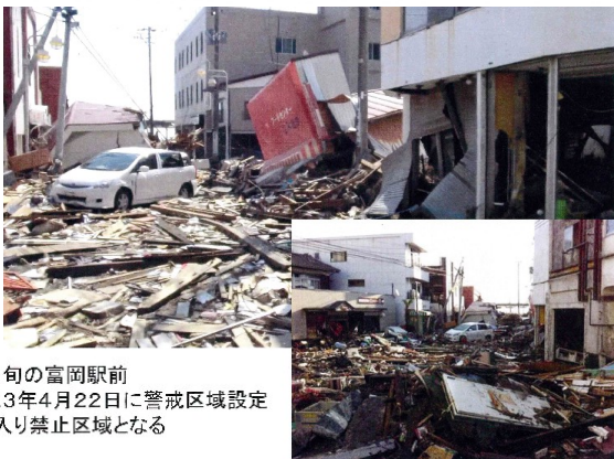
○4月中旬の富岡駅前 ○平成23年4月22日に警戒区域設定 立ち入り禁止区域となる