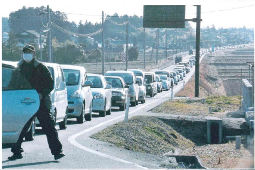
富岡町から避難する町民らの車で渋滞する道路—12日午前7時30分ごろ