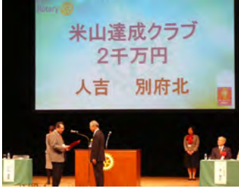
米山達成クラブ2千万円 鳥井会長登壇

小山ガバナーより、「凄い事ですね。」と耳打ちされたそうです。私達ロータリアンも誇らしげでした。