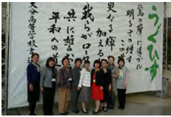
第2回本会議スタート前の人吉ロータリークラブの美女軍団