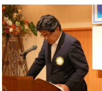
上田一精会計より 決算報告書収支の説明