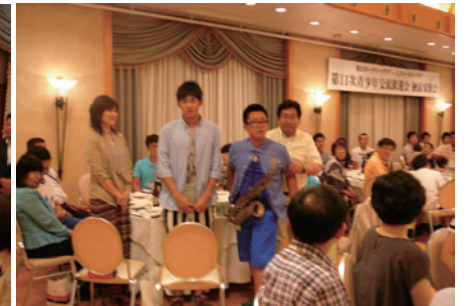
リュウソンハ君と葉山ファミリー