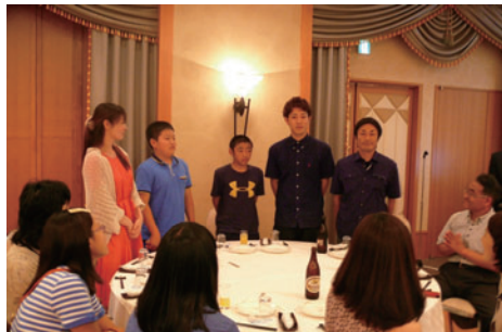
ペゼウック君と戸高ファミリー