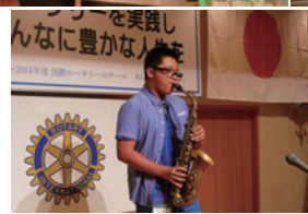
リュウソンハ君のサクソ☆