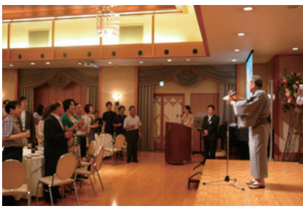
韓国語で乾杯 コンベ견배!