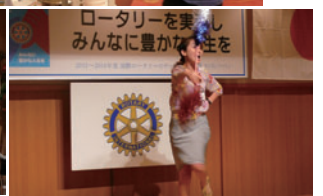
上杉さんのダンス☆